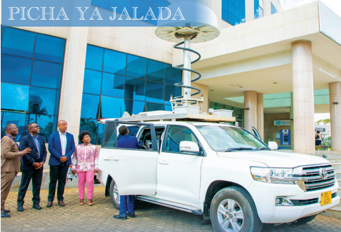
Gari la TCRA lenye mtambo wa kufuatilia matumizi na mwelekeo wa masafa ya mawasiliano.