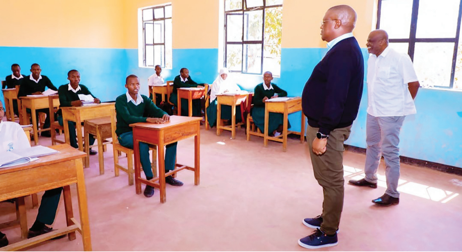
Waziri wa Habari, Mawasiliano na Teknolojia ya Habari, Mhe. Nape M. Nnauye akizungumza na wanafunzi shule ya sekondari kijiji cha Msomera, wilayani Handeni, Mkoani Tanga, ambako waliokuwa wakazi wa eneo la hifadhi ya Ngorongoro, Arusha wamehamia kwa hiyari na wamepangiwa makazi. Miundombinu ya mawasiliano ya kisasa imejengwa eneo hilo kusambaza huduma za mawasiliano.

vifaa vya mkononi na mezani Tanzania kama msingi wa kujenga uchumi wa kidijitali na uchumi wa buluu.